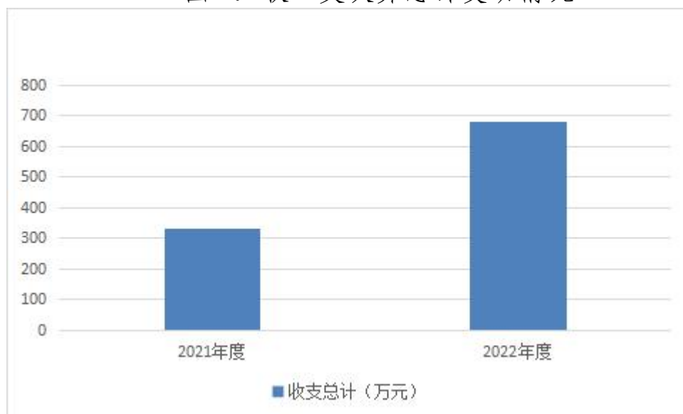
图 1：收、支决算总计变动情况

2022 年度收、支总计均为 682.85 万元。与 2021 年度相比，收、支总计各增加 352.27 万元，增长 106.6%，主要原因是新增体育产业创新发展“面对面”活动、百个规上体育招商引资项目推介活动、公共体育场馆改革试点研究、体育消费券和支持我省体育企业参展等相关工作经费。